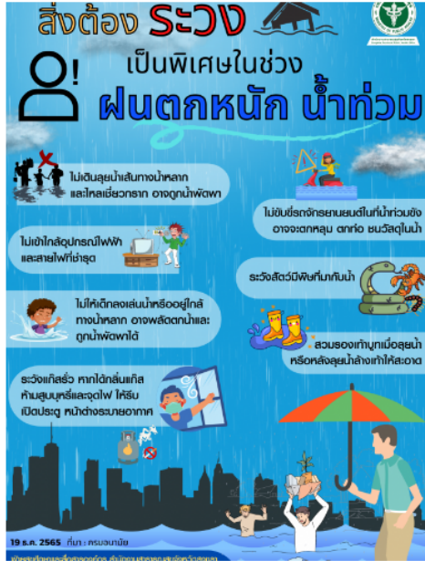
Infographicสิ่งที่ต้องระวังเป็นพิเศษในช่วงฝนตกหนัก น้ำท่วม