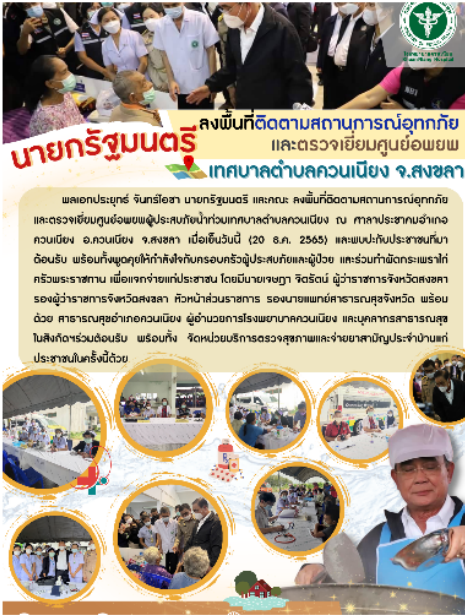
onepageนายกรัฐมนตรื ลงพื้นที่ติดตามสถานการณ์อุทกภัย อ.ควนเนียง