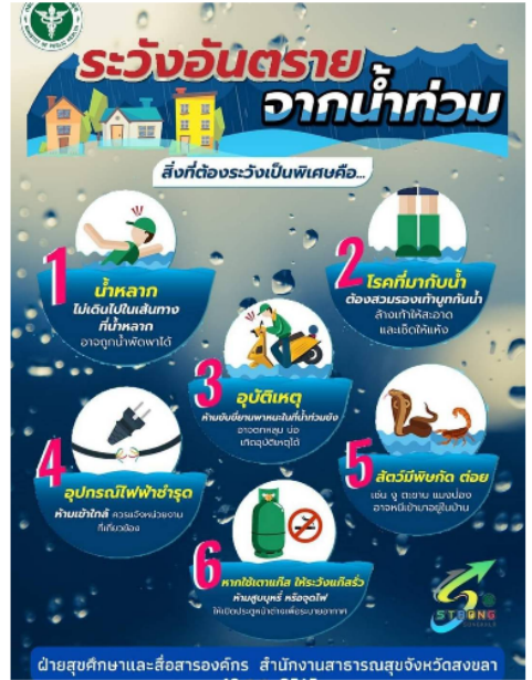
Infographicระวังอันตรายจากน้ำท่วม